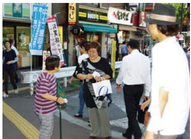
谷、荻窪の3駅で「怒りの大行動」として、後期高齢者医療制度の廃止

【板橋】消費税をなくす板橋の会と消費税廃止会と消費税廃止を求め、福祉・年金の予算に回せ」などと訴えました。いまにも夕立が降りそうななかでしたが、前定例宣伝を署員103筆が寄せられ、ティッシュ500を配布しました。 【杉並】杉並の会は、区内の各団体に協賛、24日に高円寺、阿佐ヶ谷、荻窪の3駅で「怒りの大行動」として、後期高齢者医療制度の廃止