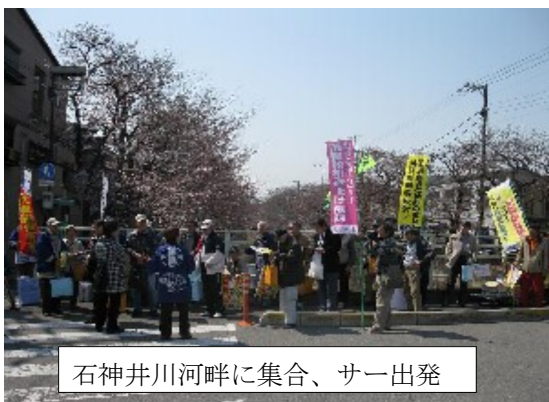
石神井川河畔に集合、サー出発

消費税をなくす板橋の会と板橋各界連絡会は、3月29日、中根橋に集合、桜満開の石神井河