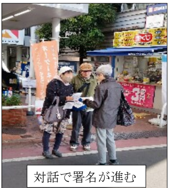
対話で署名が進む